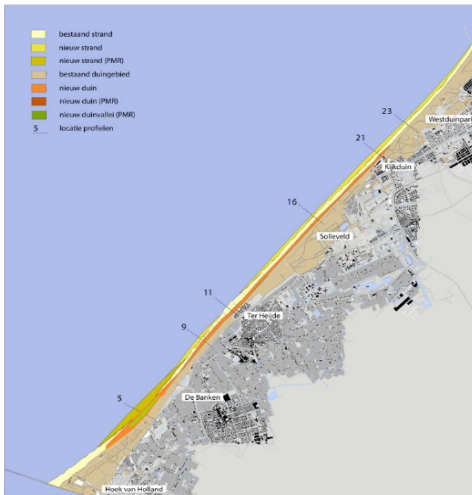
Figuur 1: Locatie duincompensatie Delflandse Kust en zwakke schakel Delfland.

Onderstaande figuur 1 laat de locatie zien waar de duincompensatie in combinatie met de versterking van de zwakke schakel Delfland zijn aangelegd.