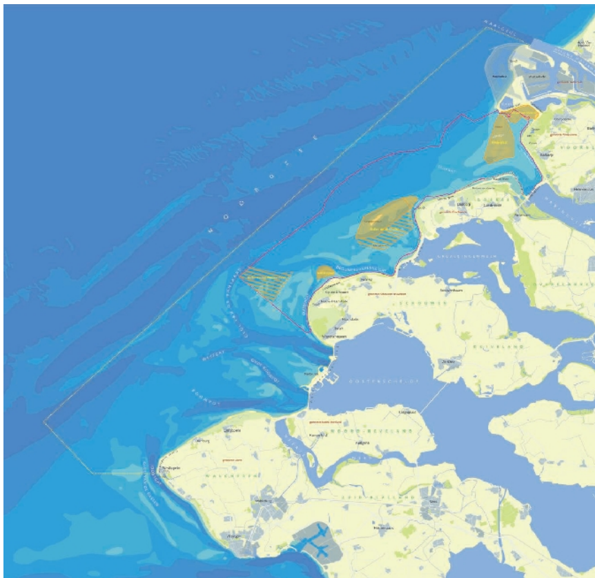
Figuur 2: Voordelta en het daarin gelegen bodembeschermingsgebied (binnen de rode contour) met rustgebieden (geel: jaarrond en geel gearceerd: alleen gedurende de winter)

Onderstaande figuur 2 laat zien waar het bodembeschermingsgebied met de bijbehorende rustgebieden is gelegen in de Voordelta.