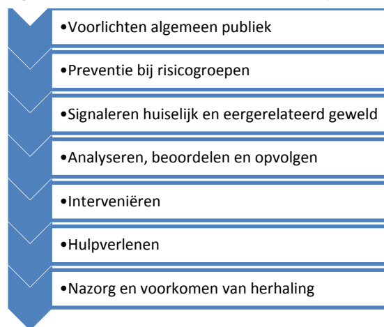
Figuur 4.1 Lokale ketenaanpak huiselijk en eengerelateerd geweld

Voor de stappen 3 tot en met 7 van deze keten (van signalering tot en met nazorg) bestaat op lokaal niveau een structuur waarin de relevante partijen elk een plaats hebben. Deze structuur is weergegeven in figuur 4.2. In deze figuur is te zien op welke manier signalen van huiselijk geweld bij de politie, AMK of de steunpunten terecht komen en naar wie ze worden doorverwezen. Signalen kunnen op twee manieren worden gemeld. De 'vindplaatsorganisaties' kunnen signalen rechtstreeks melden aan de genoemde partijen of via de casus-overleggen waaraan ze deelnemen, zoals de zorgadviesteam, het veiligheidshuis of het casusoverleg van het Centrum voor Jeugd en Gezin.