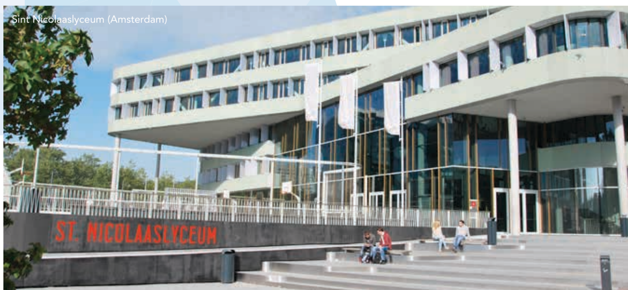
Sint Nicolaaslyceum (Amsterdam)