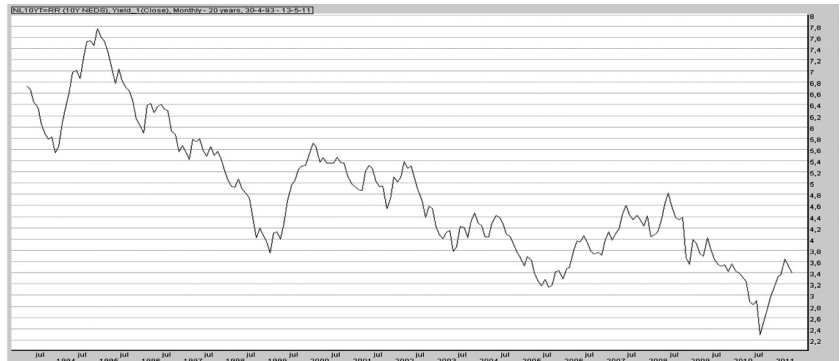
Grafiek 2. Ontwikkeling 10-jaarsrente in percentages (rechteras) tussen 1993 en 2011.