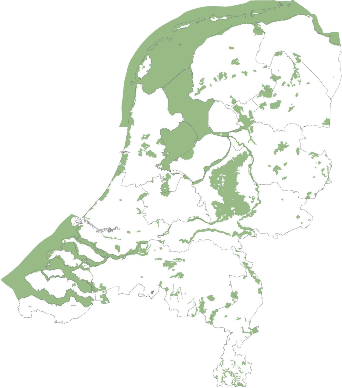
Afbeelding 1 Natura 2000-gebieden (165) (bron Ministerie EZ)