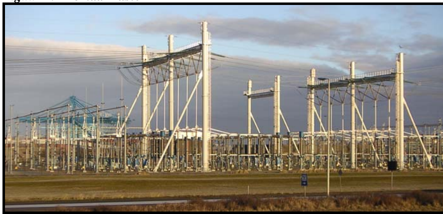
Figuur 2.1 Portaalmasten

Overigens is gebleken dat een deel van het tracé hoe dan ook ondergronds moet worden aangelegd. Dit betreft de passage van de bedrijventerreinen Beukenhorst (Oost Oost) en De Hoek. Hier is door zowel bovengrondse bebouwing als ondergrondse kabels en leidingen fysiek onvoldoende ruimte beschikbaar voor (de bouw van) hoogspanningsmasten. Dit gebied kan alleen gepasseerd worden door een ondergrondse kabel. De lengte van die kabel zal circa 2 tot 5 kilometer bedragen, afhankelijk van het te kiezen tracé; dit wordt nader uitgewerkt in het kader van de vervolgbesluitvorming over het precieze tracé van de verbinding.