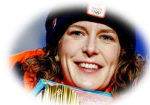
Ireen Wüst – meest succesvolle Olympiër ooit (zeer) trots: 65%