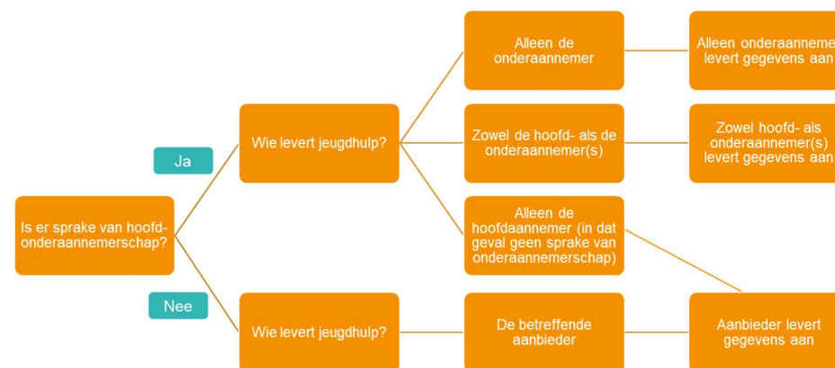
Figuur 2. Schematische weergave voor het al dan niet aanleveren van gegevens bij HOA

beide partijen (een deel van de) jeugdhulp leveren, dienen zij over deze geleverde hulp informatie aan te leveren. Indien alleen de onderaannemer zorg levert, dient alleen de onderaannemer informatie aan te leveren. In figuur 2 is dit schematisch weergegeven.