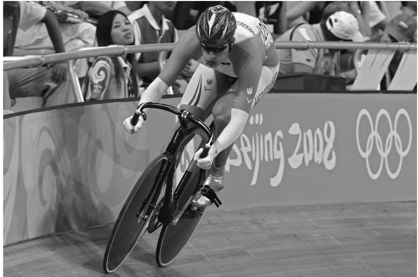
Meervoudig sprintkampioen Theo Bos in actie in Beijing.

productiekosten met zich meegebracht. Het is vanzelfsprekend dat de opgedane ervaringen later in het reguliere productieproces worden benut.