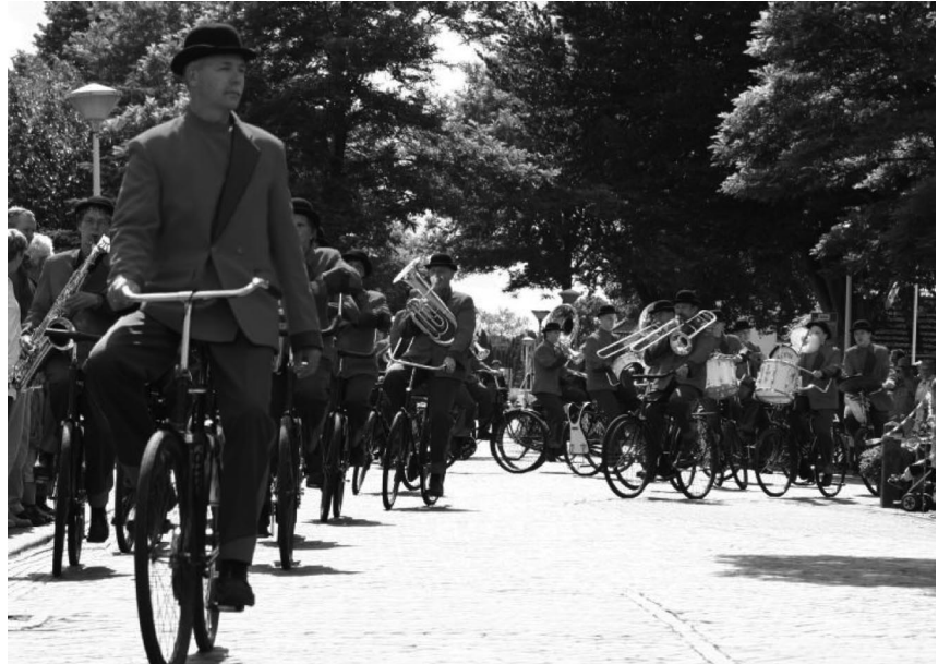
Het fietsende muzikpeloton van Crescendo uit Opende (Gr)