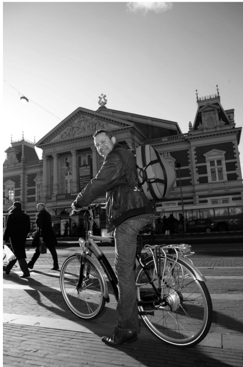
De elektrische fiets of E-bike.

Eén van de meest recente vernieuwingen binnen de fietsbranche is de introductie van de elektrische fiets. Deze E-bike is een fiets waarbij de kracht die de fietser op de pedalen zet, dankzij een elektrisch systeem wordt aangevuld. Daardoor wordt het fietsen gemakkelijker en wordt het mogelijk om zonder extra inspanning een grotere afstand te overbruggen.