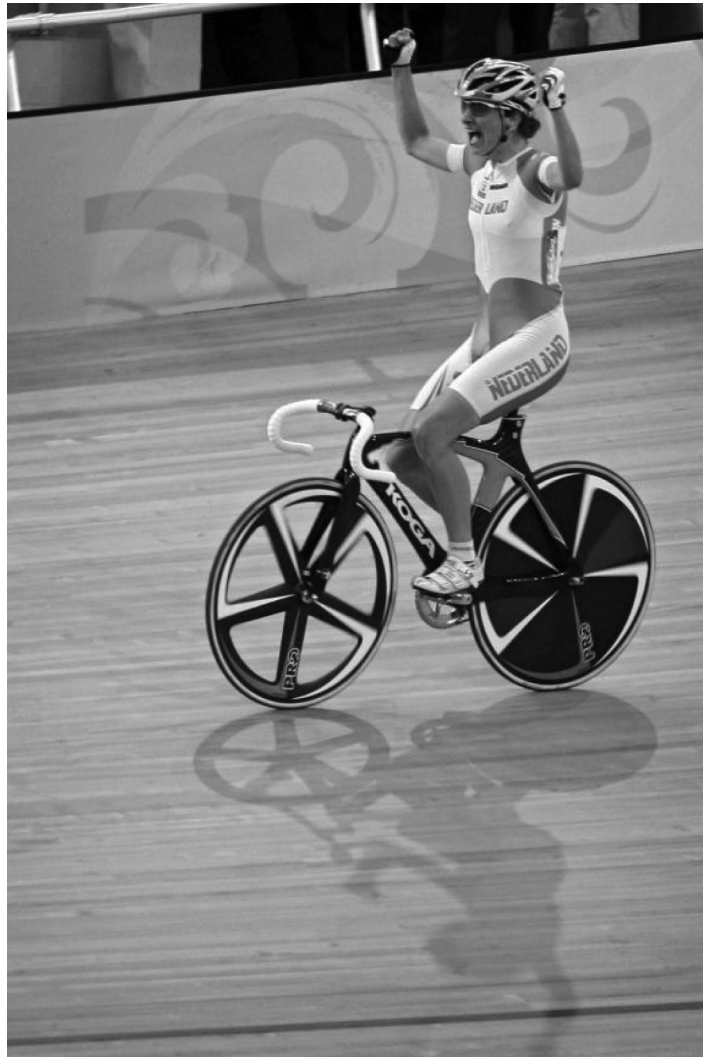
Marianne Vos wint Olympisch goud op de wielerveen in Beijing (2008). In 2010 worden in Apeldoorn de wereldkampioenschappen wielrennen op de baan georganiseerd.

Nederland is wereldwijd het belangrijkste fietsland. Prestaties in de wielersport ondersteunen dit beeld krachtig. Het positieve beeld kan verder worden versterkt door structureel in te zetten op de organisatie van grote en aansprekende fiets- en wielerevenementen.