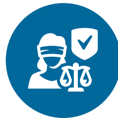
Waarden en rechten, rechtsstaat en veiligheid