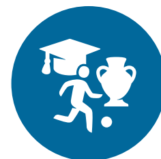
Onderwijs, cultuur, jeugdzaken en sport