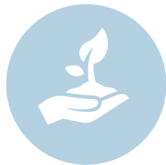
Klimaatverandering en milieu