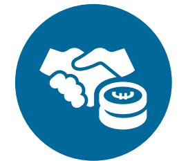
Een sterkere economie, sociale rechtvaardigheid en werkgelegenheid