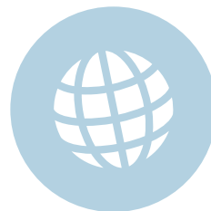
Rol van de EU in de wereld