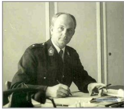
RP-adjutant met rood potlood, 1973

aan het OM. Door incomplete en incorrecte PV's op VVC is er veel rework nodig op aangeven van het OM; de samenwerking in ZSM heeft een beperkt lerend effect (Ter Horst 2016).