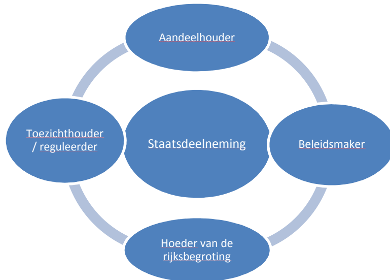
Figuur 1 Staatsdeelneming en de overheid