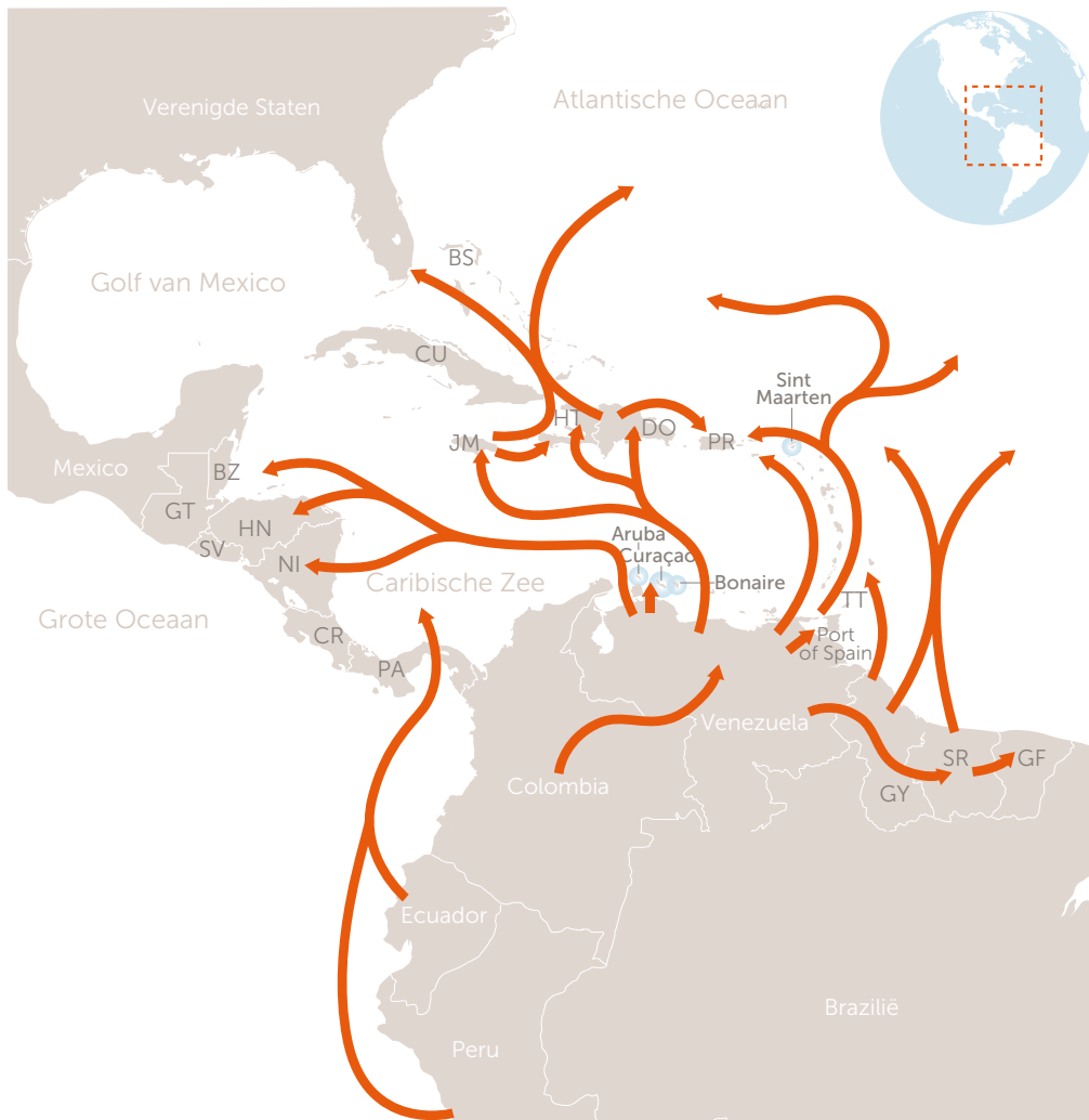
Figuur 2 - Drugsroutes Caribisch gebied