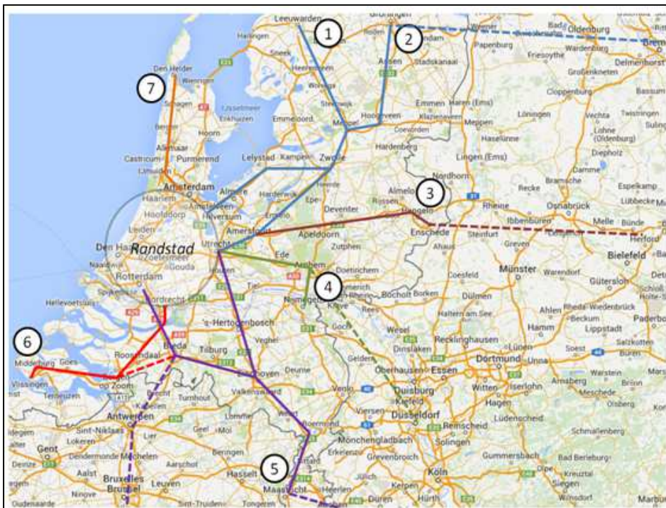
Figuur 1: overzicht van de in de motie genoemde tracés.

In reactie hierop en naar aanleiding van overleg aan de OV- en Spoortafels eind 2014 met alle relevante partijen is over deze QuickScan aan de Tweede Kamer gemeld 1 dat IenM alle eerder gedane onderzoeken op dit terrein verzamelt en de conclusies vervolgens zal verifiëren tegen de huidige context en ontwikkelingen, om die vervolgens aan de OV- en Spoortafels voor te kunnen leggen. Dit proces is afgerond. Deze notitie bevat de uitkomsten van de QuickScan.