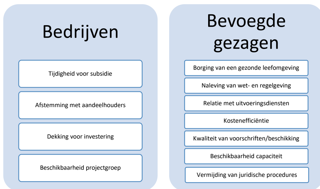
Figuur 2: de belangen die bedrijven en bevoegde gezagen hebben bij snelle vergunningprocedures

Bedrijven en overheden hebben in het kader van vergunningverlening verschillende belangen. Uiteindelijk hebben beide partijen wel dezelfde onderliggende behoefte; zekerheid, duidelijke en transparante besluitvorming.