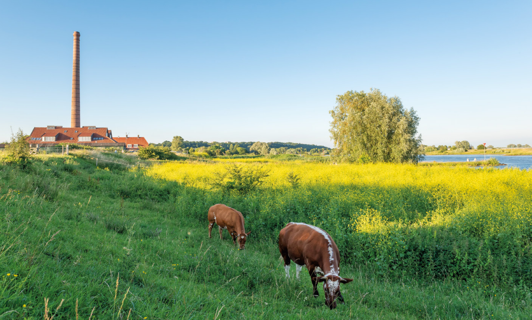
Begrazing in de uiterwaarden bij de oude steenfabriek langs de Nederrijn bij Wageningen