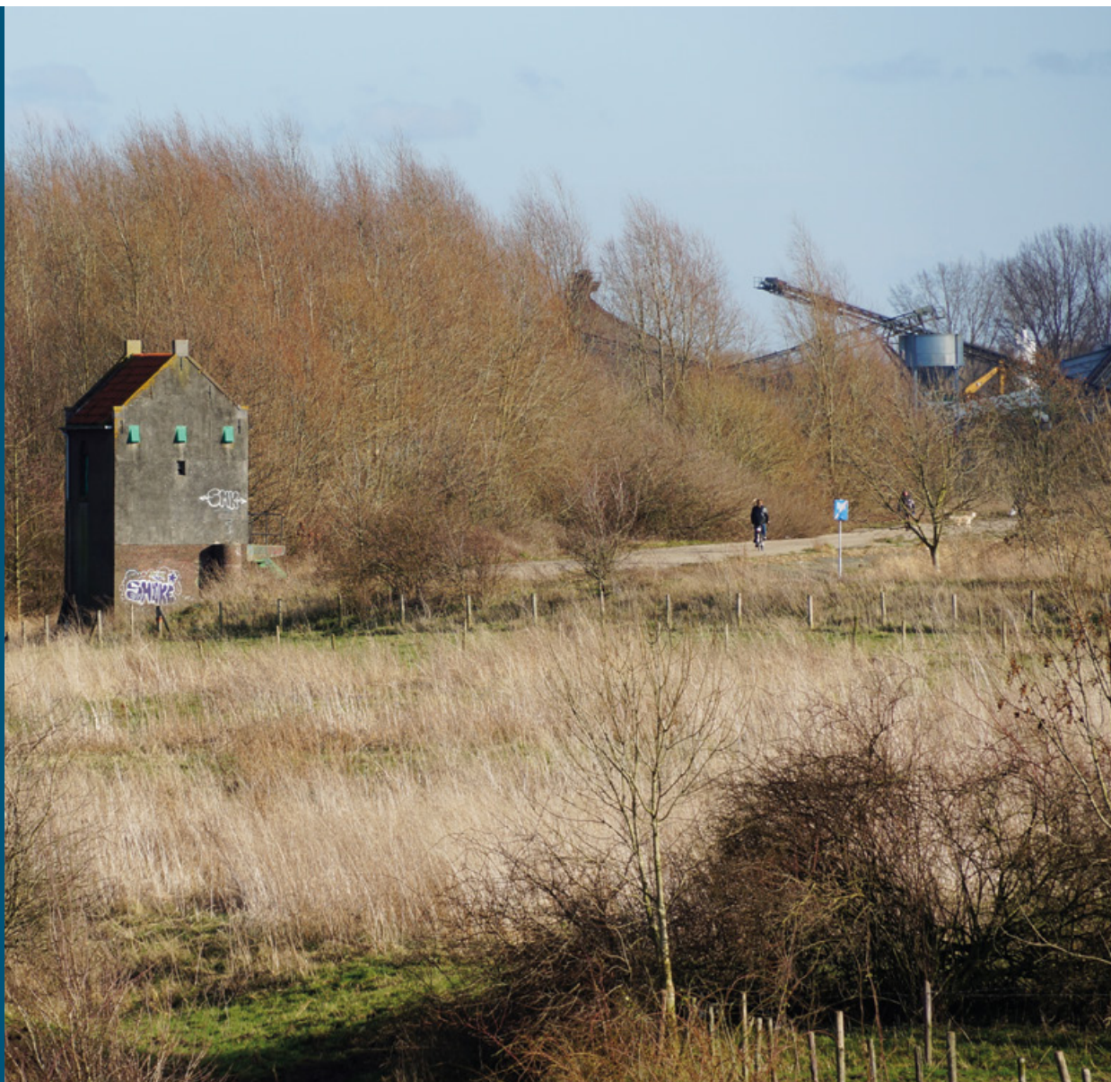
Bemmelse Waard (Waal): defensiedijk met cultuurhistorisch pomphuisje en delfstofwinning (rechts)

De inrichting van dit gebied is in samenwerking met delfstoffenwinners tot stand gekomen. De zandwinning heeft zoveel extra ruimte voor de rivier opgeleverd dat er oerbos tot ontwikkeling kan komen. De herinrichting voor rivierverruiming is inmiddels klaar; er wordt nog gewerkt aan verdere optimalisatie voor de natuur. Bij de werkzaamheden hebben de archeologische waarden speciale aandacht gekregen. Zo is de kolk die in 1799 achterbleef na een verwoestende dijkdoorbraak (waarbij het dorp Doornik door het water werd verzwoegen) intact gebleven. In het gebied liggen verschillende onderdelen van de IJssellinie (een defensiewerk uit de Koude Oorlog), zoals de Defensiedijk en kazematten. Deze zijn als onderdeel van het project beter zichtbaar en beleefbaar gemaakt, in samenspraak met de lokale historische vereniging. Staatsbosbeheer en Rijkswaterstaat hebben het prikkeldraad rond hun eigen terreinen verwijderd. Het gezamenlijke gebied is toegankelijk voor bezoekers die hier ook buiten de paden mogen struinen. Bijzonder onderdeel van de natuur zijn het grote en relatief oude zachthoutoebos en de rivierduintjes waar brede ereprijs en zandweegbree groeien. Op een warme zomeravond is hier de boomkrekel te horen.