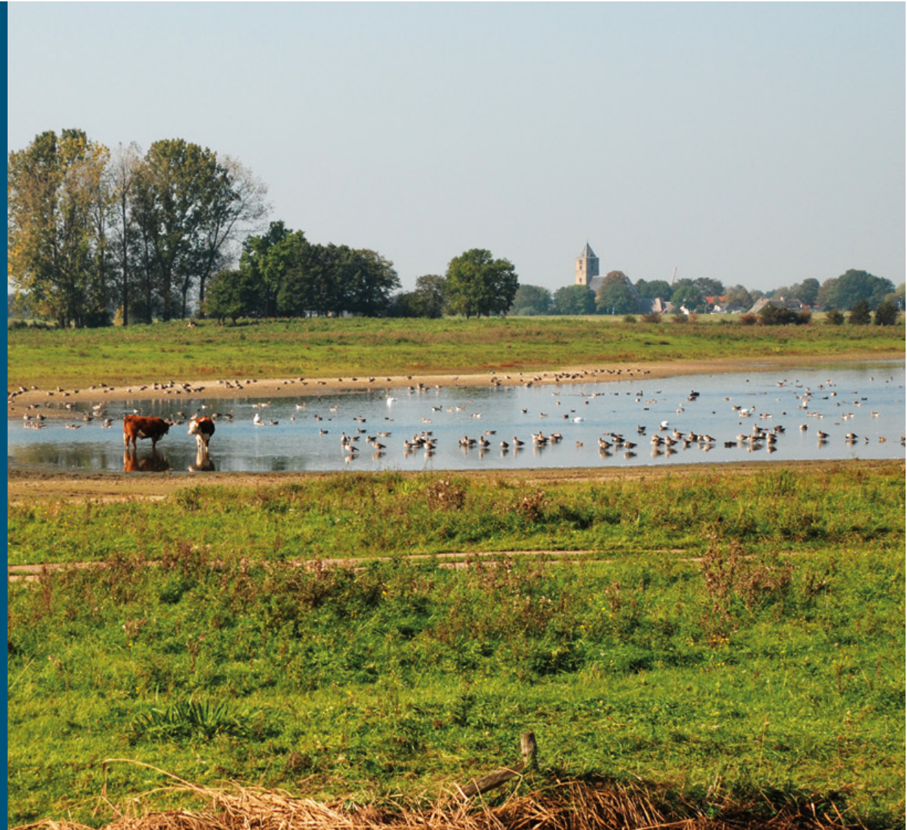
Vreugderijkerwaard met Zalk op de achtergrond | Cobie Uiterwijk

Na de hoogwaters van 1993 en 1995 besloot een boer zijn land in de Vreugderijkerwaard te verkopen en elders een nieuw bedrijf te beginnen. Dat luidde een snelle verandering in: een paar jaar later ging de herinrichting van start. Er kwam een meestromende nevengeul met flauwe oevers, er ontstond moeras en een (niet gepland) ooibos. In het begin - het pionierstadium - broedden er kluten op de zandige oevers. Nu de natuurlijke successie verder is gevorderd, is het een eldorado voor steltlopers die hier tijdens de trek foerageren en uitrusten: grutto's, watersnippen, kemphanen en verschillende soorten ruiters. Tussen de nevengeul en de IJssel ligt een fraaie oeverwal met glanshaverhooiland, begraasd door runderen. De grond die vrijkwam bij de herinrichting bleek tegen de verwachting in niet geschikt voor dijkversterkingen: er zat te veel zand in. Toevallig speelde op dat moment ook de natuurontwikkeling in het Ketelmeer. De aannemer heeft de grond uit de Vreugderijkerwaard benut om daar eilanden aan te leggen. Daar broedt nu een zeearend die af en toe in de Vreugderijkerwaard komt foerageren.