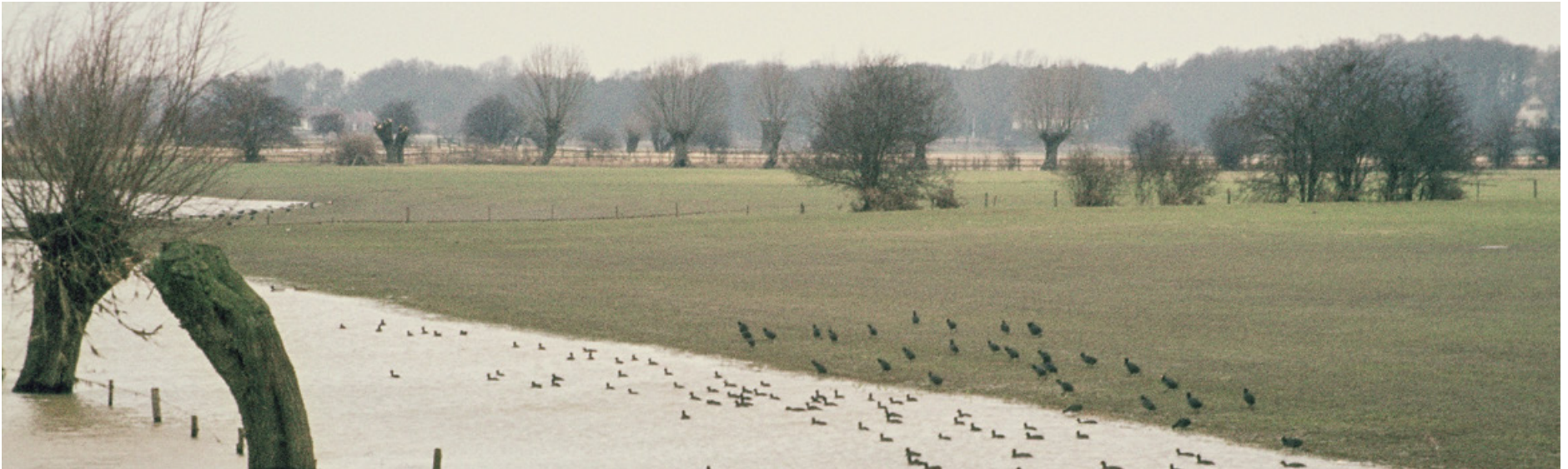
Rivierdijken: hoogwater in de IJssel, kwel binnendijks

Werk aan het rivierengebied is nooit af. Het programma Integraal Riviermanagement verbindt verschillende opgaven op het gebied van waterveiligheid, bevaarbaarheid, zoetwaterbeschikbaarheid, waterkwaliteit, natuur en een (economisch) aantrekkelijke leefomgeving. De transities in de landbouw (natuurinclusieve landbouw, circulaire landbouw) en de stikstofaanpak (Programma Natuur van het ministerie van LNV) kunnen nieuwe kansen voor synergie brengen. Zo wordt het rivierengebied nóg mooier en natuurlijker.