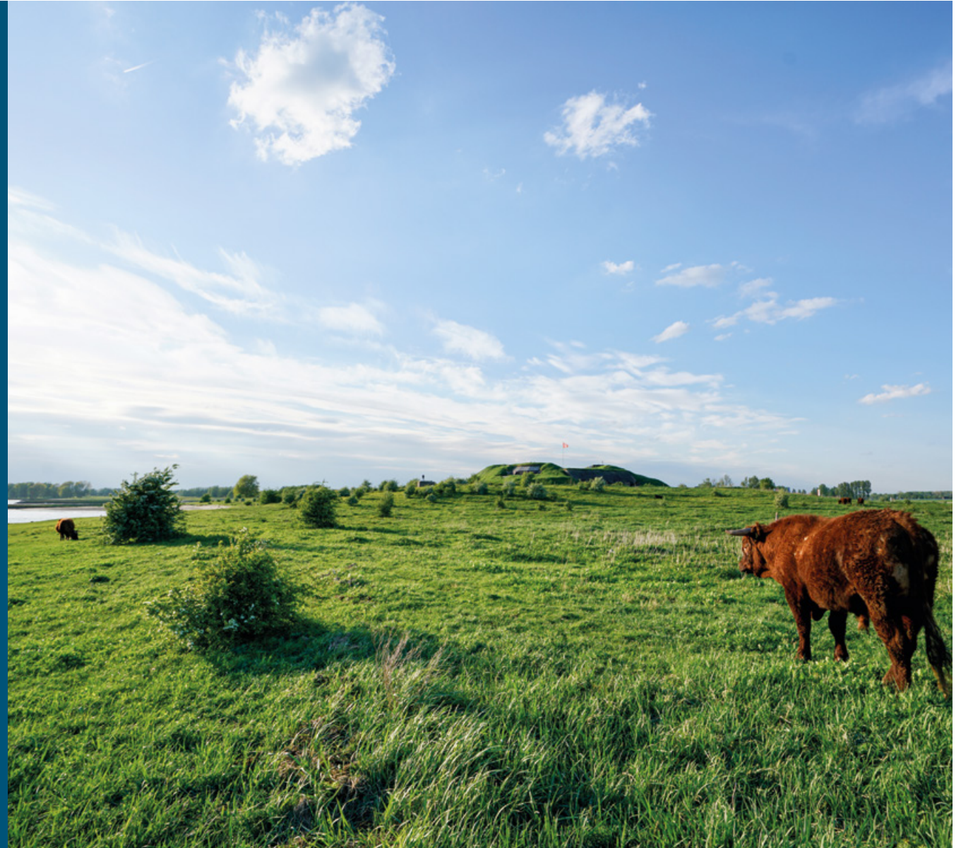
Uiterwaarden bij Fort Pannerden met begrazing door rode Geuzen

In de Klompewaard leeft sinds enkele jaren de weidesprinkhaan. Deze sprinkhaan is waarschijnlijk in 1946 uitgestorven in Nederland, maar is nu teruggekeerd op de zandige oeverwallen en de verdedigingswallen van het magistrale fort Pannerden bij de Klompewaard. Vanuit dit gebied verspreidt de soort zich verder naar uiterwaarden aan de overkant van de Waal. Het is een van de successen van dit kleine gebied op de splitsing van de Waal en het Pannerdensch Kanaal. Ook andere pioniersoorten die heel lang zeldzaam waren, doen het hier weer goed, zoals slijkgroen en klein vlooienkruid. Polei, een muntachtige die bijna niet meer voorkomt in Nederland, is hier massaal aanwezig. Het konijn is inmiddels op de Rode Lijst beland, maar heeft hier een gezonde populatie. Al deze soorten profiteren van begrazing door paarden en runderen.