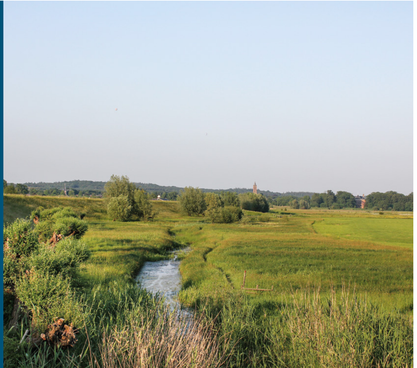
Amerongse Bovenpolder met Amerongen op de achtergrond

Hier, aan de voet van de Utrechtse Heuvelrug, borrelt schoon kwelwater naar boven. Die bijzondere situatie was de sleutel om heel eigen riviernatuur tot ontwikkeling te laten komen. Door de bovenste bodemlaag weg te graven zijn uitgestrekte kwelmoerassen en een rivierkwelgeul ontstaan. De afgegraven klei is verkocht aan de nabijgelegen steenfabriek en gebruikt voor dijkversterking. Dat leverde een flinke besparing op. Rijkswaterstaat zag kansen voor de Kaderrichtlijn Water en betaalde mee aan de aanleg van de zes kilometer lange kwelgeul, zes hectare paaiplaatsen en een verbinding met de Nederrijn via een vistrap. Ook de provincie Utrecht leverde een financiële bijdrage. In het waterrijke gebied leven nu moerasvogels (zoals waterral, sprinkhaanzanger en baardmannetje), vissen die van stilstaand of langzaam stromend water houden (zoals alver en winde), verschillende amfibieën en de ringslang en de bever bouwen er burchten.