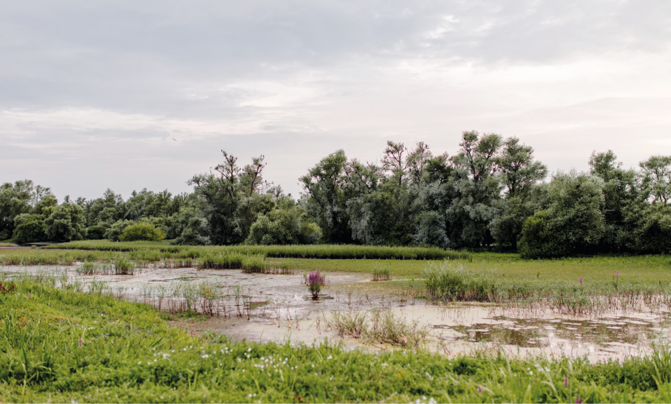
Overstromingsgraslanden in Hengforderwaarden, Olst-Wijhe | Marleen Annema fotografie