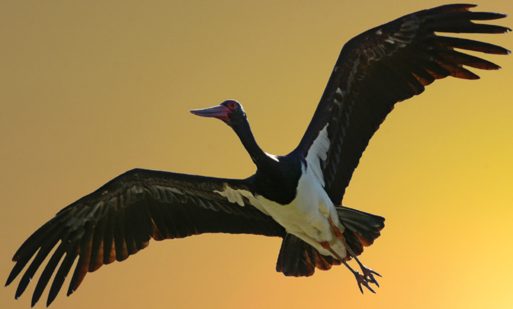
Zwarte ooievaar