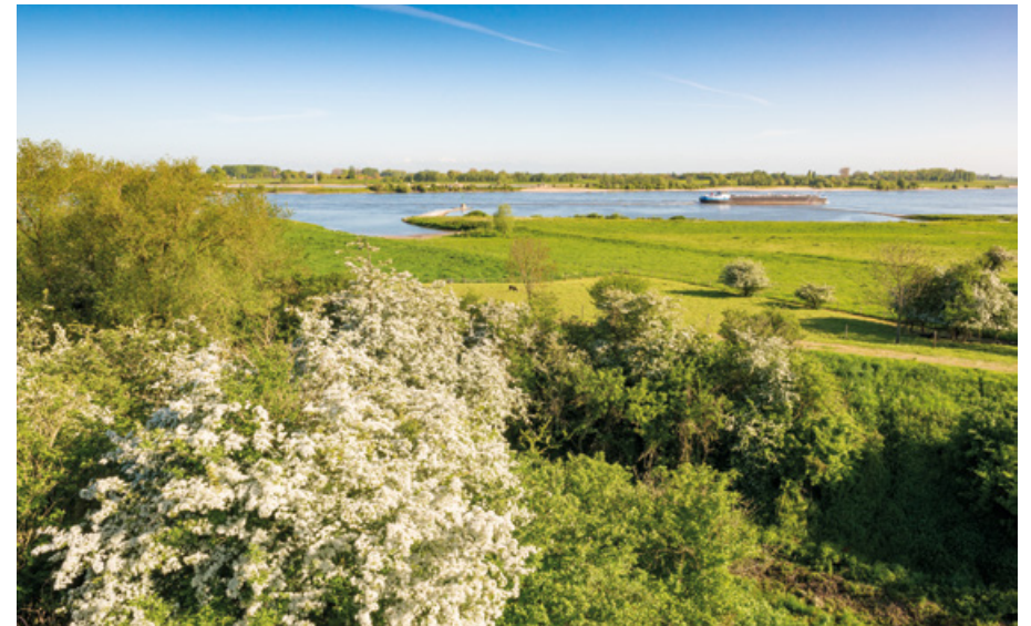
Uiterwaarden langs de Waal bij Fort Sint Andries

Ook op regionaal niveau ontstonden nieuwe initiatieven. Een voorbeeld is Waalweelde, een integraal plan voor het gebied rond de Waal tussen Pannerden en Loevestein. Onder regie van de provincie maakten regionale overheden, bedrijven en natuurorganisaties hier samen ideeën voor nieuwe bedrijvigheid, aantrekkelijke woongebieden, een mooie leefomgeving en nieuwe natuur. Niet alle ambities zijn uiteindelijk werkelijkheid geworden, maar het is wel gelukt een impuls te geven aan NURG-projecten langs de Waal die zonder deze steun waarschijnlijk niet tot stand waren gekomen.