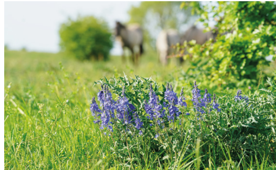
Erlecomse Waard: brede ereprijs en grazende konikpaarden

Een centrale rol is weggelegd voor het programma Integraal Riviermanagement. Dit programma verbindt verschillende opgaven op het gebied van waterveiligheid, bevaarbaarheid, zoetwaterbeschikbaarheid, waterkwaliteit, natuur en een (economisch) aantrekkelijke leefomgeving. Bekende combinaties - met dijkversterkingen, rivierverruiming en verantwoorde delfstoffenwinning - blijven goede kansen bieden. De transities in de landbouw (natuurinclusieve landbouw, circulaire landbouw) en de stikstofaanpak (Programma Natuur van het ministerie van LNV) kunnen nieuwe kansen voor synergie brengen.