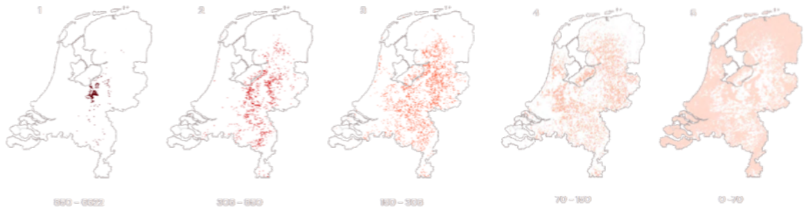
Figuur. Landbouw depositiebijdrage opgesplitst in 5x20% van de landboudepositie op alle Natura 2000-gebieden (uit Erisman en Strootman, 2021).

Voor de hier gehanteerde methode, en zoals eerder beschreven in Erisman en Strootman (2021), is het bepalend van hoeveel stikstofreductie je per bedrijf uitgaat. 100% reductie wil zeggen volledige opkoop, maar 66% wil zeggen dat het bedrijf 66% emissie moet reduceren. De berekeningen zijn per bedrijf uitgevoerd, echter is de presentatie per gebied. We hebben daarbij gezocht naar een gebiedsindeling die overeenkomt met een vergelijkbare opgave in termen van benodigde emissiereductie en die bepaalde landschappen vertegenwoordigt. De landschapsindeling van 78 cultuurlandschappen uit de RCE kwaliteitsgidsgebieden komt hiermee het beste overeen. Verder veronderstellen wij dat bij de opkoop ook de broeikasgasemissies voldoende verminderen om het doel te halen. Voor de KRW opgave is dat gedeeltelijk zo omdat er gebieden zijn waar extra maatregelen nodig zijn om de oppervlaktewater doelstelling te halen. Een eerste voorzichtige vergelijking levert het beeld dat voor grondwater extra maatregelen op de lössgronden in Limburg nodig zijn en dat in bepaalde beekdalen de opkoop niet voldoende is. Voor bovenstaande veronderstellingen ten aanzien van de klimaat- en KRW-doelen is nadere studie nodig.