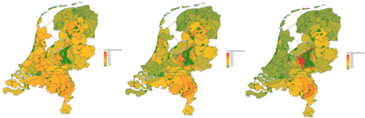
Figuur. Benodigde emissiereductie per gebied waarbij 74% van de oppervlakte Natura 2000-gebieden onder KDW komt en waarbij de maximale emissiereductie op respectievelijk 50, 66 en 100% is gezet. In de tabel staat het aantal dieren per categorie en de daarbij behorende aantal bedrijven dat verminderd wordt bij de scenario's.