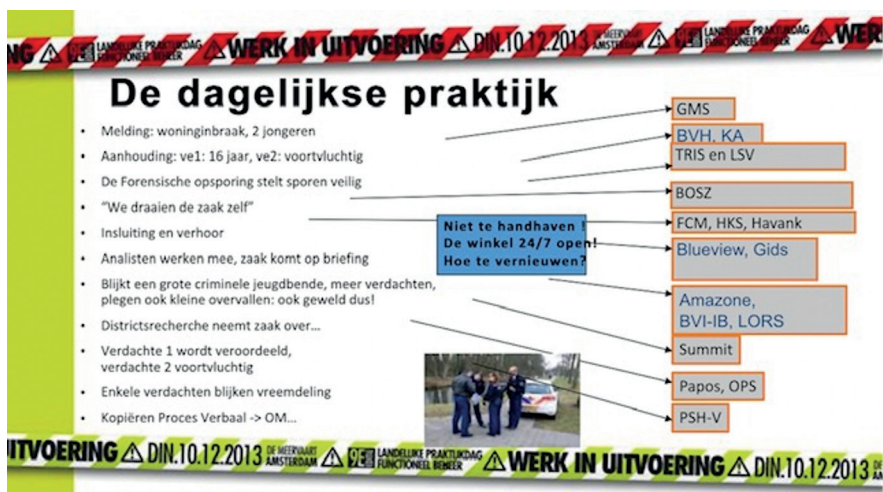
Figuur 1: Enkele systemen irt werkproces

Met betrekking tot rompslomp klaagt men veel over het gebrek aan koppelingen tussen de diverse technische en bedrijfsvoeringssystemen (BVH, Summ-IT, etc). Het duizelt velen van ons binnen de commissie nog van al de namen van die applicaties en hun onderlinge relaties.