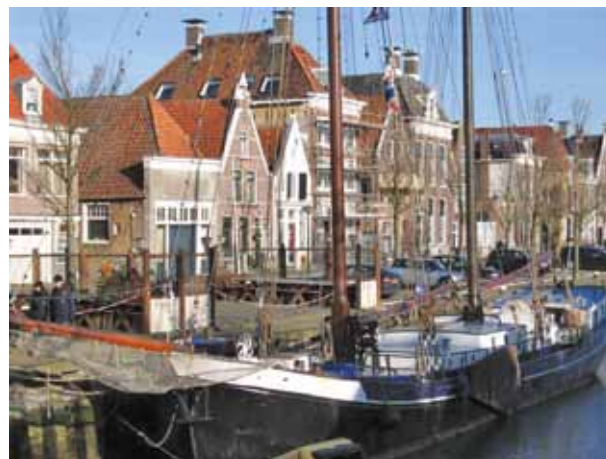
Beschermde stadsgezicht: Harlingen.

Daarnaast heeft de Erfgoedinspectie in 2008 op het gebied van instandhouding van beschermde stads- en dorpsgezichten drie gemeenten bezocht. Een daarvan had nog een pilot-karakter (Naarden), en vervolgens zijn twee gemeenten daadwerkelijk geïnspecteerd (Kampen en Harlingen).