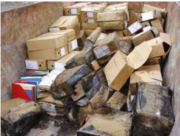
Brand Technische Universiteit Delft

De archiefruimte voldeed niet aan alle archiefwettelijke eisen. Er was geen calamiteitenplan voor de archieven opgesteld. Men beschikte niet over een volledig en betrouwbaar bestandsoverzicht van de aanwezige archieven. De universiteit brengt in kaart welke archiefdelen de brand hebben doorstaan en hoe deze hersteld kunnen worden. De Erfgoedinspectie ziet erop toe dat adequate maatregelen worden getroffen.