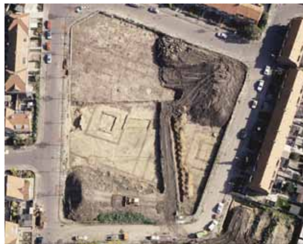
Luchtfoto van het Nijmeegse Maasplein. Foto Berry van Haren, gemeente Nijmegen, 1994

In 2008 nam het aantal gemelde opgravingen met 5,5 procent toe ten opzichte van het jaar daarvoor, van 195 naar 206. Dat is een iets kleinere stijging dan in 2007. Tegelijkertijd nam het aantal proefsleuvenonderzoeken met 18,5 procent toe, van 428 tot 508. Dit is een grotere stijging dan in 2007, en is mogelijk een gevolg van de aanpassing van de Monumentenwet 1988, waarmee het ‘de verstoorder betaalt’-principe definitief werd ingevoerd. Voor het aantal archeologische booronderzoeken geldt een stijging met 9 procent, van 2339 naar 2558. De stijging van het aantal opgravingen en proefsleufonderzoeken (die zich overigens sterker voordoet bij de gemeentelijke archeologische diensten dan bij de private ondernemingen) lijkt in tegenstelling te staan met ‘behoud in situ’, het leidende principe van de Wet op de Archeologische Monumentenzorg. Daartegenover heeft het archeologische belang met de invoering van deze wet expliciet vorm gekregen in de ruimtelijke ordening en wordt er dus ook vaker rekening mee gehouden. Waar archeologische resten vroeger ongezien verloren gingen, worden deze nu wel vaker in kaart gebracht. Het is nog onduidelijk of dit tegelijkertijd betekent dat er ook meer archeologische resten ‘in situ’ worden bewaard. Het principe ‘behoud in situ’ vormt een onderdeel van de in 2011 voorziene beleidevaluatie van de nieuwe wet.