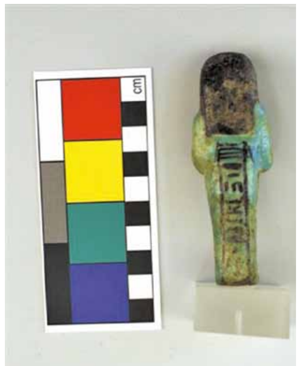
Ushebti (begravenisbeeldje, 19e dynastie (1250 vC))

In 2008 was de Erfgoedinspectie betrokken bij de teruggave aan Egypte van een ushebti (begravenisbeeldje) uit de 19 de dynastie (1250 vC). Uit onderzoek bleek dat het inderdaad om een in Egypte beschermd cultureel voorwerp ging. In juli 2008 is het beeldje namens de minister van OCW aan de Egyptische ambassadeur overhandigd. Administratief is het een lastig en tijdrovend proces. Niettemin is deze zaak goed en adequaat opgelost, een signaal aan de Egyptische autoriteiten dat Nederland de regelgeving zorgvuldig en actief naleeft.