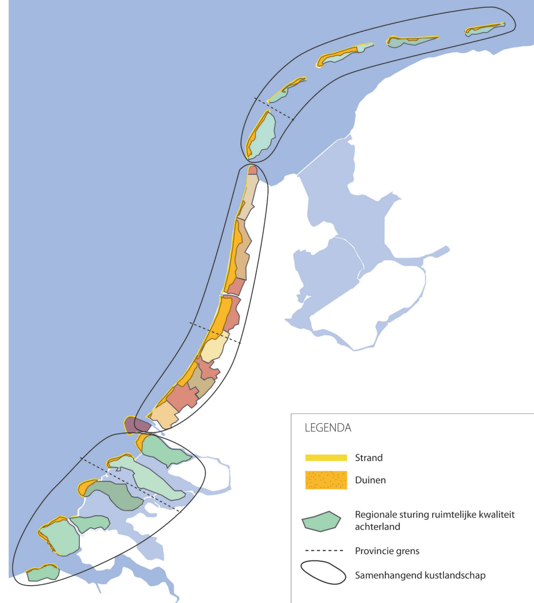
Figuur 2 Achter de duinen