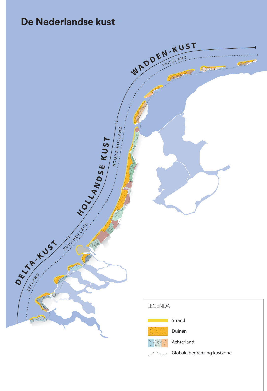
Figuur 3 de drie samenhangende delen van de Nederlandse kust

Juist daar waar provincies een kust delen die in landschappelijke zin gelijk is (zie figuur 3 voor de drie samenhangende delen van de Nederlandse kust) is er reden om extra scherp te zijn op het creëren van samenhang en het voorkomen van ongewenste concurrentie tussen provincies en/of gemeenten. Het verdient aanbeveling om in het vervolg bij het vaststellen van nieuwe zoneringen voor kuststranden alsnog aandacht aan te besteden aan een gezamenlijke legenda.