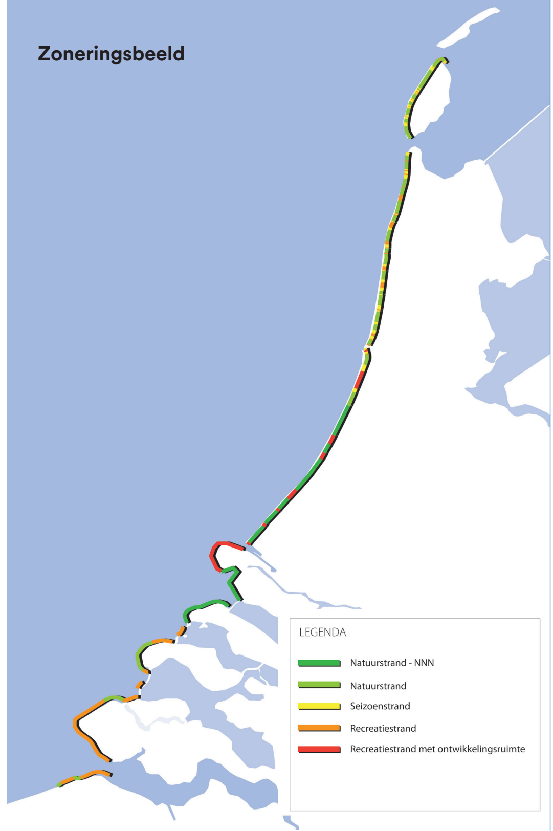
Figuur 1 Zoneringsbeeld