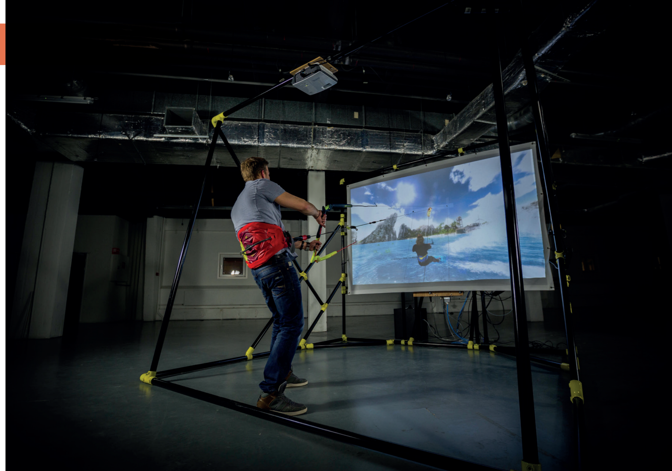
Kite Sim is de eerste realistische kitesurfsimulator