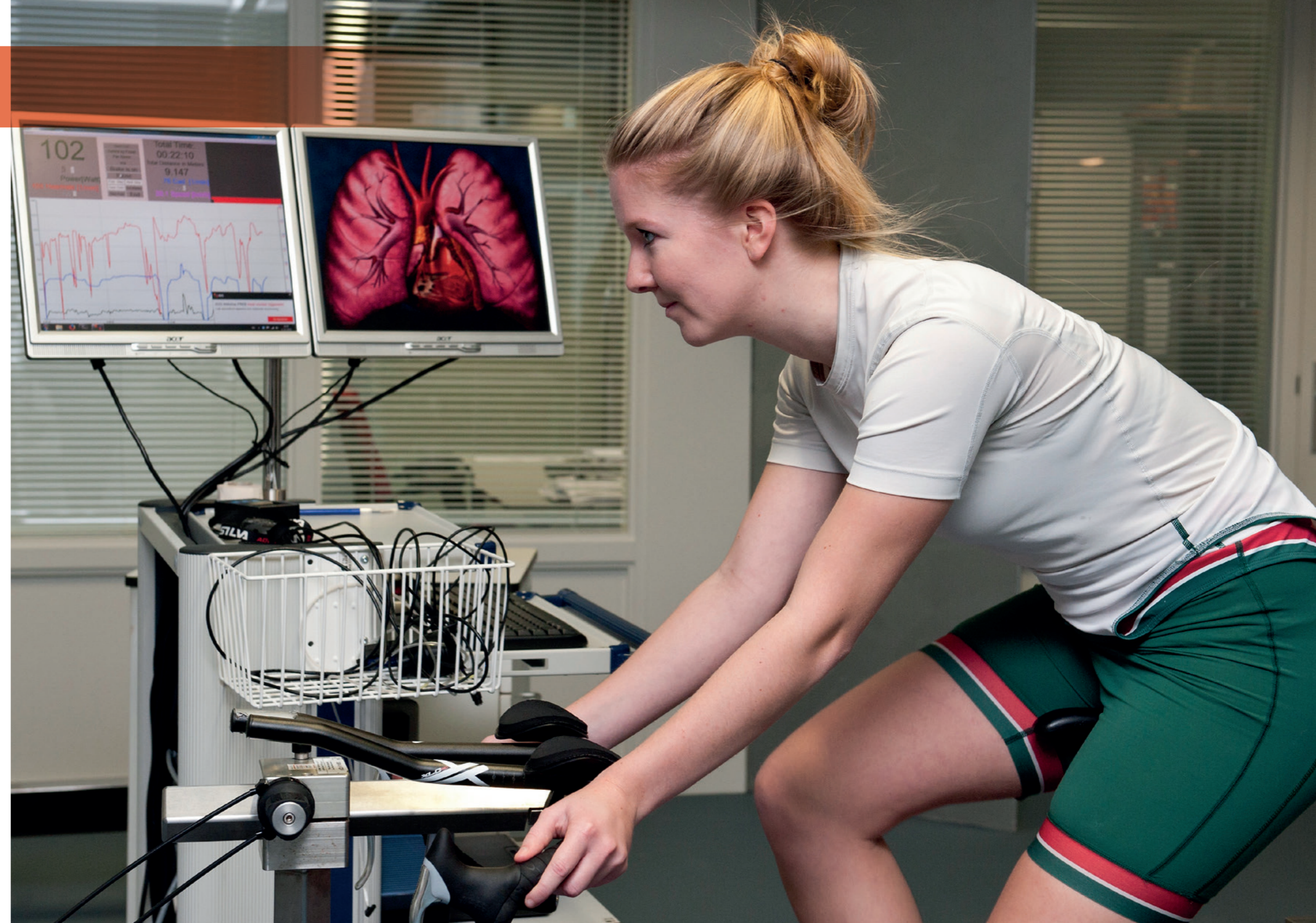
Foto: Meten is weten op InnoSportLab Papendal