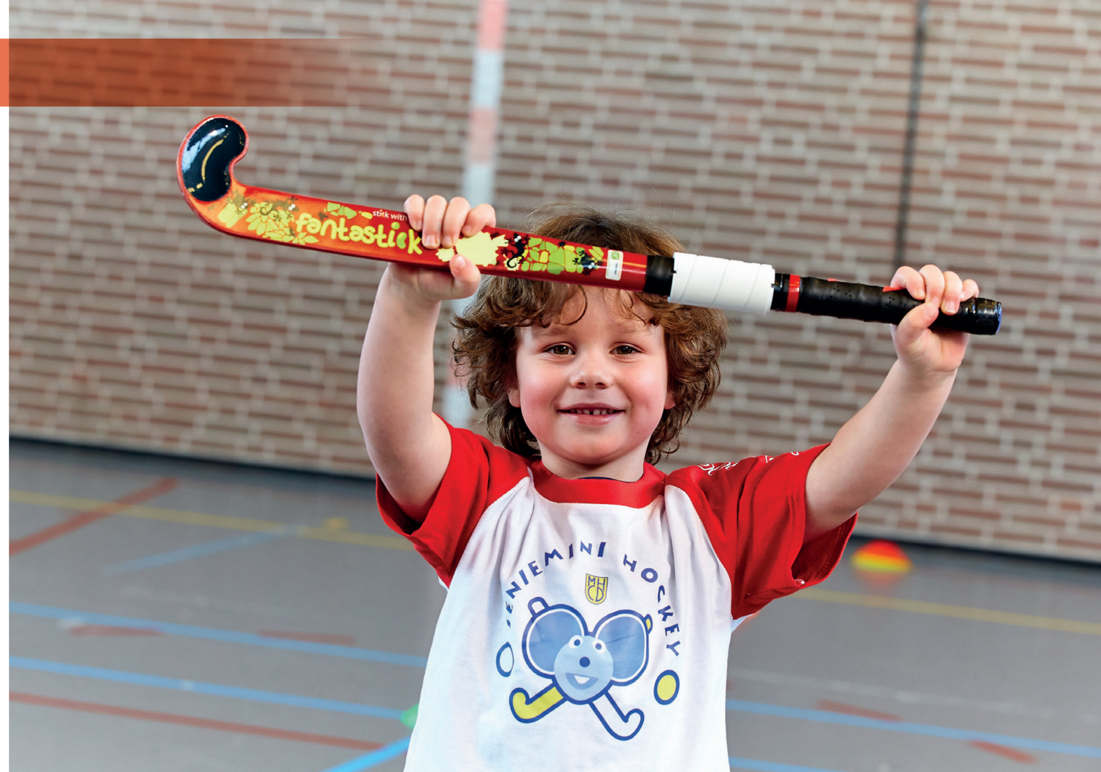
De Fantastick is een innovatieve junior hockeystick speciaal ontwikkeld voor kinderen tussen 3 en 7 jaar

Er wordt aan de sport, het bedrijfsleven, de overheden en de wetenschap gevraagd om deze ingediende voorstellen op hun merites (mee) te beoordelen. Er zal op basis van de input uit het netwerk en de gestelde criteria een transparante keuze worden gemaakt voor de beste voorstellen.