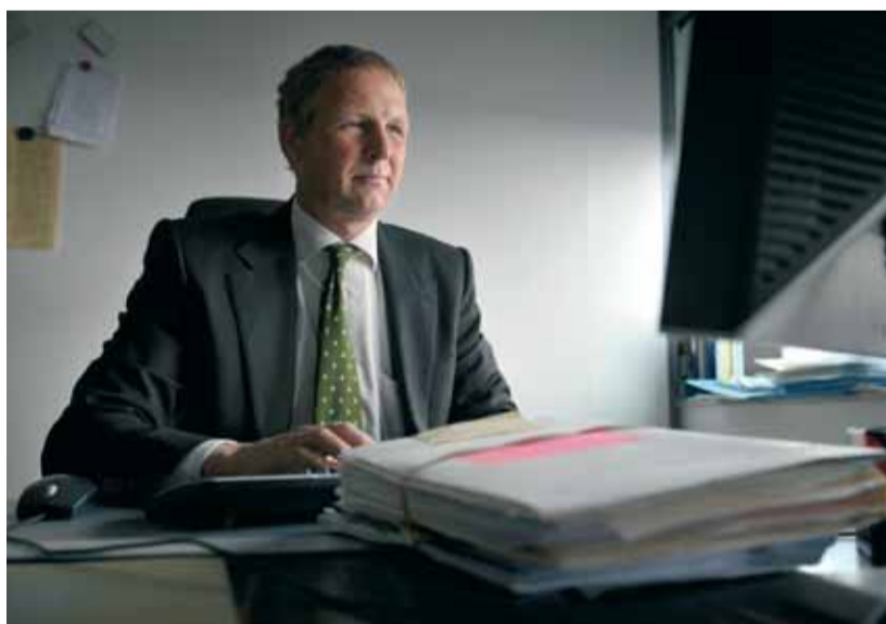
Hoofdofficier van het parket Alkmaar Jeroen Steenbrink.

Wat is nieuw in de wet VPS? Steenbrink: "Beleid en wetgeving om slachtoffers via een strafproces te ondersteunen waren er al. Maar de uitvoering door politie en OM was niet altijd even eenvoudig. Met de nieuwe wet krijgen slachtoffers veel beter en sneller wat hen toekomt. Ze bevat onder meer de voorschotregeling, waarbij de staat in ernstige zaken schadevergoeding voorschiet aan het slachtoffer zodat