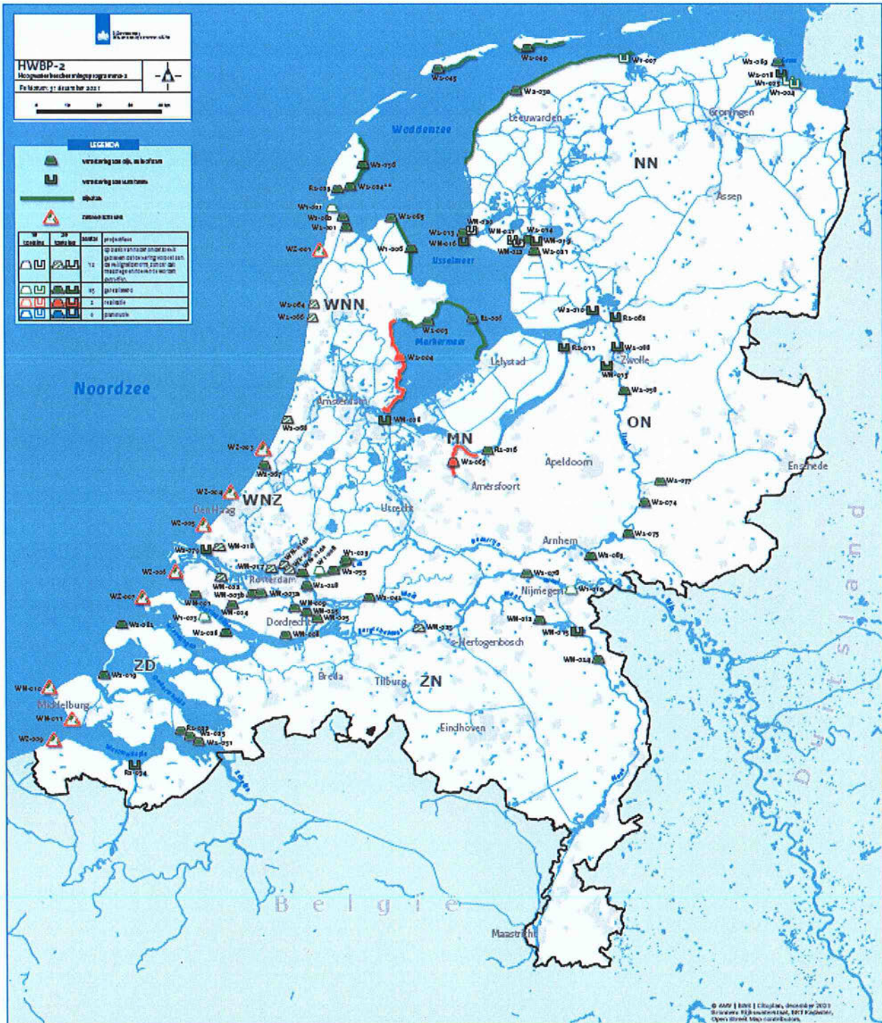
Figuur 2 Actuele scope van het programma, peildatum 31 december 2021