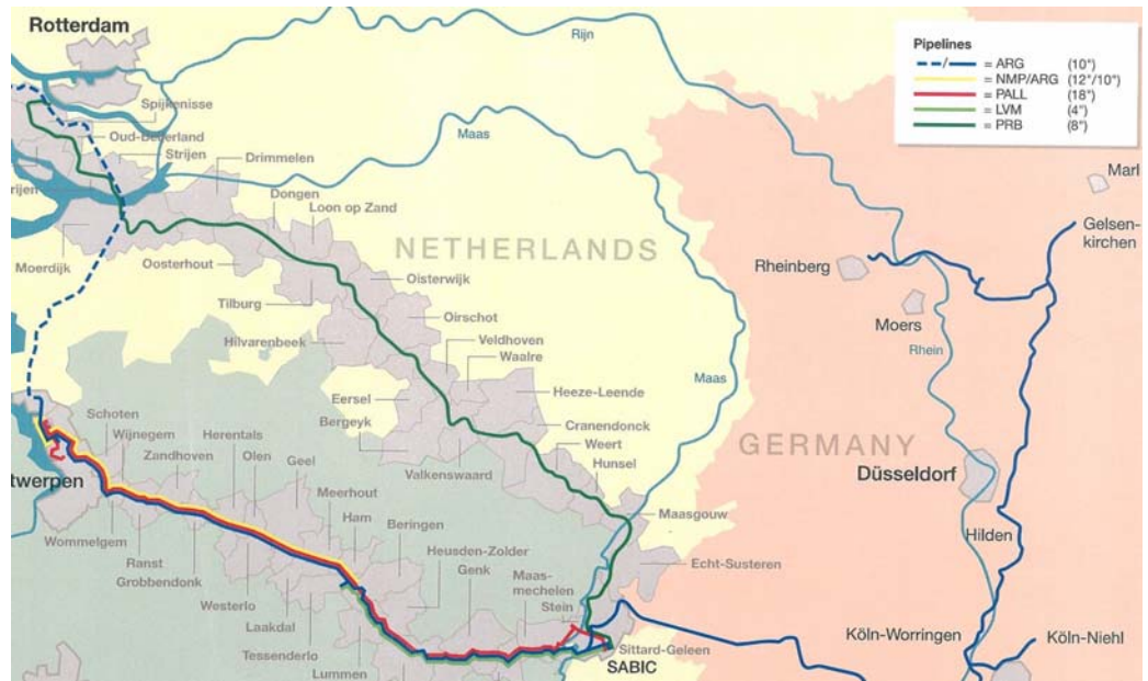
Tracé PRB (kaart van 15 mei 2007)

Op onderstaande kaart is het tracé in groen aangegeven. De buisleiding ligt deels solitair en deels in een bundel met andere buisleidingen (buisleidingstroken).