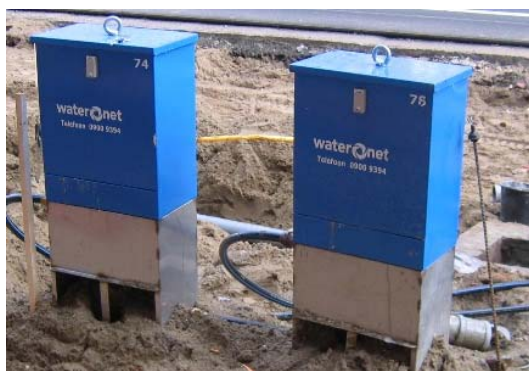
Figuur 6: Monsternamekasten.