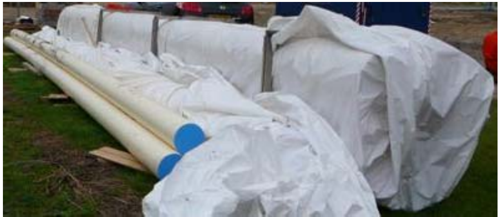
Figuur 3: Opslag van materiaal: verpakt, afgedopt en van de grond.