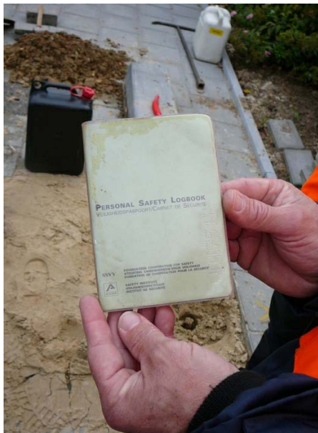
Figuur 2: Veiligheidspaspoort.