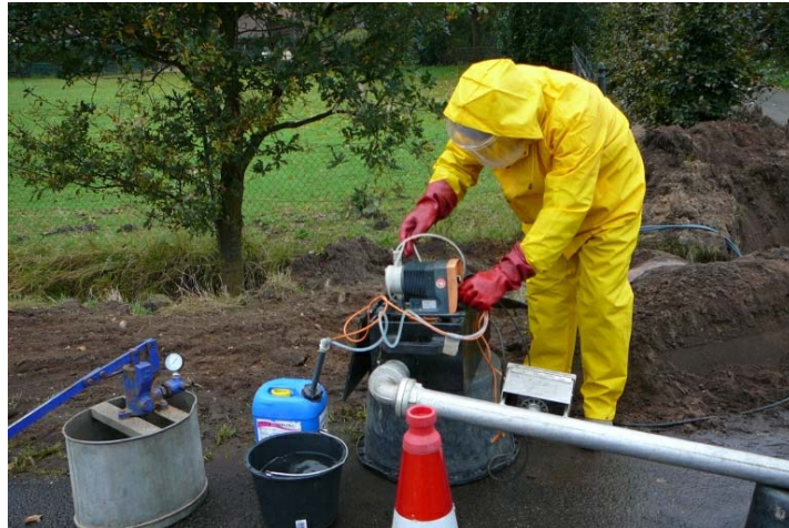
Figuur 5: Desinfecteren van de waterleiding.