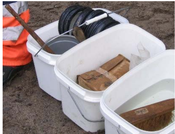
Figuur 4: Hulpmiddelen: water en zeep ingebouwd in de deur van de bus en desinfectiemiddel met een borstel.