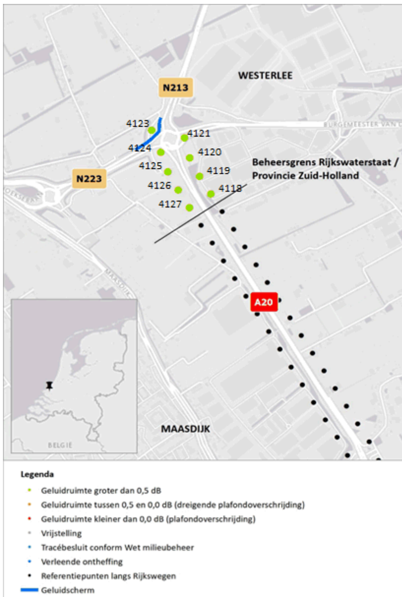
Figuur 2 Geluidruimte naleving 2019 t.o.v. geldende geluidproductieplafonds provinciale wegen