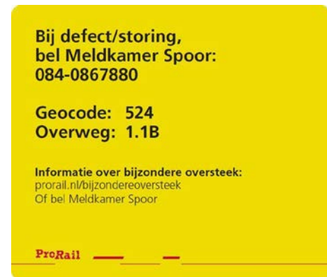
Figuur 4. Voorbeeld van sticker om overweggebruikers te informeren over een bijzondere oversteek

De inspectie verwacht ook van ProRail dat zij actiever gaat monitoren op bijzondere oversteken. De behandelde aanvragen voor een Bijzondere oversteek geven nog niet het beeld dat alle, vooral bijzondere wegtransporten, de procedure kennen. In het verleden deden zich meerdere ernstige incidenten voor met bijzondere wegtransporten. De inspectie verwacht dat deze transporten meerdere keren per jaar plaatsvinden. Daarbij zouden de overweggebruikers de procedure zeker moeten volgen. De inspectie denkt dat overweggebruikers dat niet altijd doen vanwege de minimale aanvraagperiode van 48 uur.