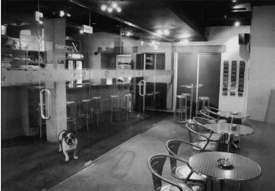
Figuur 3 Voorbeeld van een rookruimte. Dreigt de sociale functie van de coffeeshop verloren te gaan?

terwijl 27% aangaf dat de overlast gestegen is (1 coffeeshop gaf aan dat de overlast minder is geworden). De meeste last ondervindt men van "meer mensen die buiten voor de coffeeshop sigaretten (en joints) roken" en van "buiten voor de coffeeshop rondhangende groepjes mensen". Zie voor een overzicht van de gegevens Tabel 4.