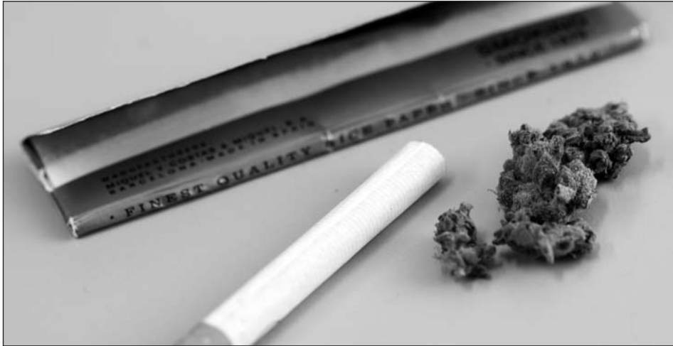
Figuur 2 Ingrediënten voor het maken van een joint. In Nederland bestaat een joint meestal uit een combinatie van cannabis en tabak.

pure joints (optie C), 6 coffeeshops hebben ervoor gekozen de gehele coffeeshop rookvrij te maken (optie E), 3 keer is er voor gekozen om de coffeeshop om te bouwen tot louter een afhaaloket (optie A) en 9 maal is aangegeven dat de coffeeshop vóór de invoering van de rookvrije horeca al een afhaaloket was of heeft men overige maatregelen genomen (optie F), bijvoorbeeld een zeer goed werkend afzuigsysteem. Optie D (geen sigaretten toestaan, maar wel joints met tabak) werd 19 maal genoemd, maar wordt niet onder “het nemen van maatregelen” geschaard. Zie voor een overzicht van de gegevens Tabel 3.