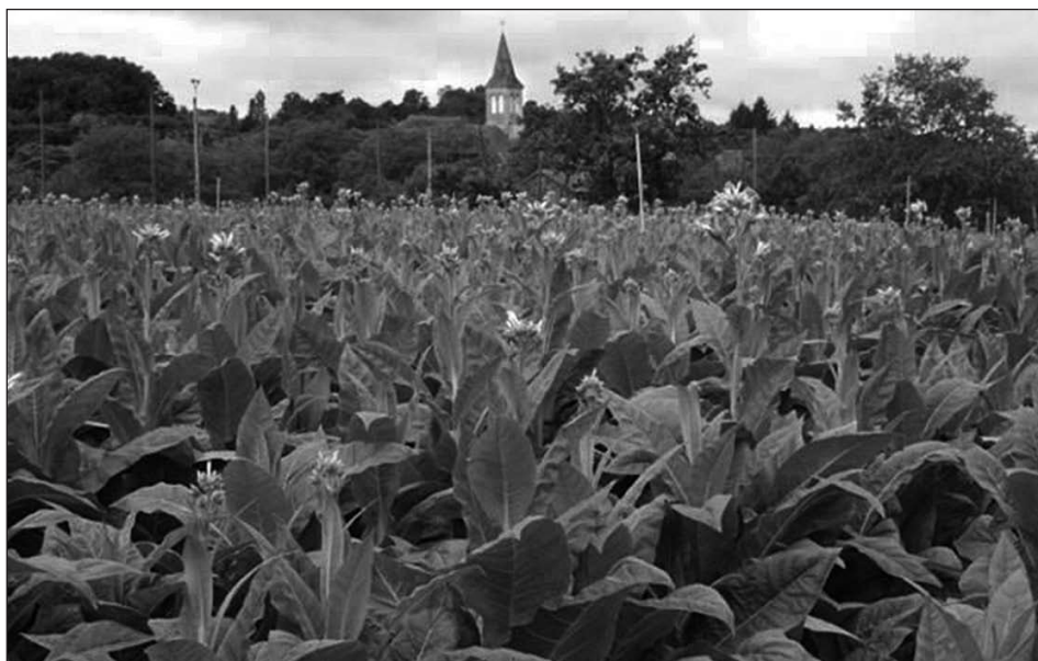
Figuur 1 Bloeiende tabaksplanten ( Nicotiana tabacum ) in de Franse Dordogne.

De Voedsel en Waren Autoriteit, VWA, (voorheen Keuringsdienst van Waren) is belast met het toezicht op de naleving van de rookvrije horeca. De dienst beschikt over controleurs die hier speciaal voor zijn opgeleid. Wordt de Tabakswet overtreden dan kan een boete worden opgelegd. In dat geval maken de controleurs een boeterapport op, dat wordt verzonden naar en beoordeeld door de Afdeling Bestuurlijke Boetes. De Afdeling Bestuurlijke Boetes is een onafhankelijk bureau, dat handelt namens de Minister van VWS. Een eerste overtreding van het rookverbod en rookvrije werkplek kan een boete van € 300 opleveren. Bij volgende overtredingen verdubbelt dit en kan de boete oplopen tot € 2.400 per overtreding. De VWA controleert in coffeeshops organoleptisch (ruiken en zien) of er in een joint ook tabak zit. Alleen in de aparte rookruimten mogen tabaksproducten gerookt worden.[9-12]