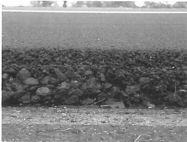
figuur 1 Zijaanzicht van een tweelaags ZOAB