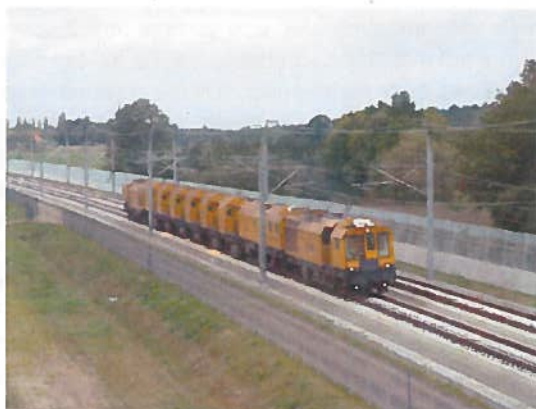
figuur 7 Slijpen van het spoor

Op dit moment is slijpen als geluidmaatregel niet aangewezen als geluidbeperkende maatregel in de Rmg. In de praktijk wordt het wel reeds op twee trajecten ingezet als maatregel om het railgeluid te verminderen. Op de HSL-Zuid wordt slijpen sinds circa tien jaar als geluidmaatregel toegepast om ervoor te zorgen dat de geluidmissie van het ballastloze spoor op deze lijn niet méér is dan die ten gevolge van een ballastspoor met betonnen dwarsliggers. Op de lijn Groningen – Leeuwarden wordt sinds 2015 slijpen als geluidmaatregel toegepast als maatregel om de GPP's na te leven.