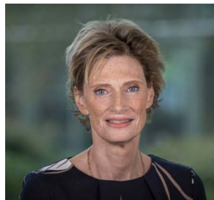
Alida Oppers Inspecteur-generaal van het Onderwijs

Juist onder de omstandigheden waarmee we nu te maken hebben, is de vraag wat de rol van de inspectie is. Die blijft: beoordelen, informeren, agenderen, activeren en soms ook interveniëren en aanjagen. Eraan bijdragen dat alle betrokkenen hun rol en hun verantwoordelijkheid nemen. Denkend vanuit het onderwijsstelsel en interveniërend daar waar dat het meeste nodig is. Dat deden we ook in 2020, met alle beperkingen die er waren. In dit jaarverslag verantwoorden we ons over ons werk in het voorbije jaar. In getallen en in een aantal belangrijke ontwikkelingen.