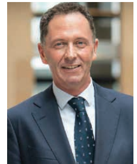
Inspecteur-generaal Sociale Zaken en Werkgelegenheid