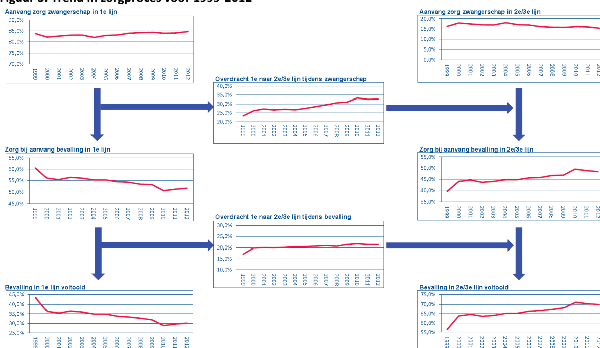
Figuur 3. Trend in zorgproces voor 1999-2012

Bron: Perinatale Registratie Nederland, Grote Lijnen 1999-2012, december 2013.