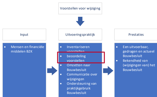
Figuur 4. Het hier beschreven onderdeel van de beleidstheorie

Na de inventarisatie van de voorstellen, doet het ministerie van BZK een eerste beoordeling. Hierbij wordt geanalyseerd in welke mate het achterliggende probleem, interventie van het ministerie van BZK vraagt door middel van beleid of regelgeving en of vervolgens het bouwbeleid of de bouwregelgeving het meest geëigende instrument is, of dat er andere instrumenten zijn die beter passen. 22 Dat kan andere wet- en regelgeving zijn, afspraken met belangenpartijen, of bijvoorbeeld een communicatiecampagne.