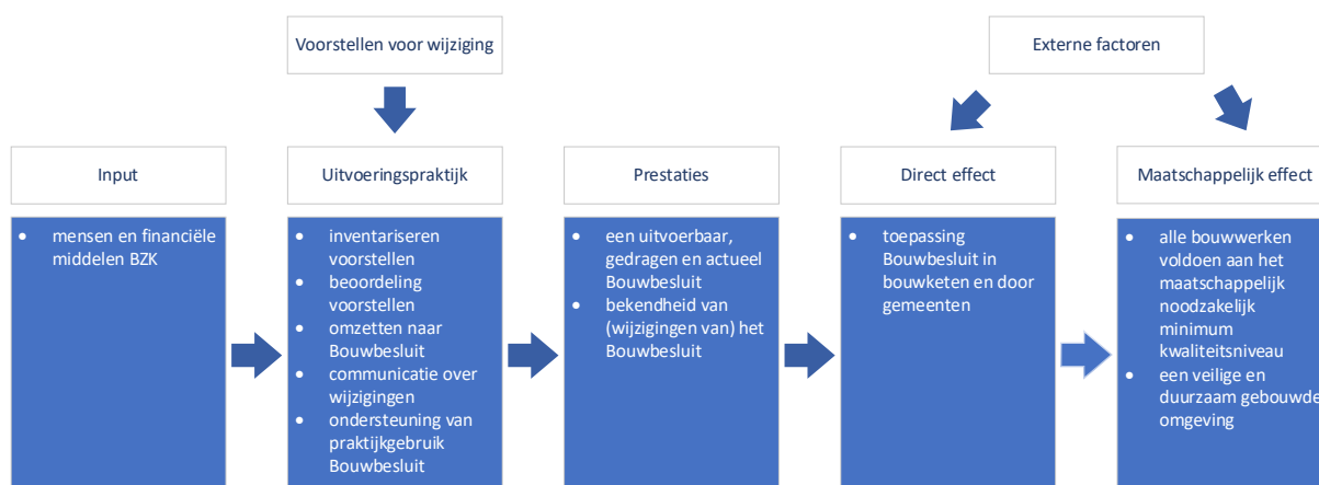
Figuur 1. De beleidstheorie voor begrotingsartikel 4.2

Het beleid dat het ministerie van BZK op begrotingsartikel 4.2 voert, is gebaseerd op een beleidstheorie, welke voor dit onderzoek is gereconstrueerd aan de hand van interviews met BZK. 3 Deze beleidstheorie is – in woorden van de Regeling periodiek evaluatieonderzoek (RPE) – de gehanteerde motivering voor het beleid en bevat de met het beleid beoogde doelen. De beleidstheorie speelt een centrale rol in deze evaluatie. Aan de hand van de beleidstheorie zijn verschillende onderdelen van het proces te onderscheiden, welke ieder beoordeeld kunnen worden op doelmatigheid en doeltreffendheid. In deze paragraaf schetsen we de beleidstheorie op hoofdlijnen. In de hoofdstukken 2 tot en met 5 verdiepen we de verschillende onderdelen van de beleidstheorie en komen we op basis van syntheseonderzoek en aanvullende interviews tot bevindingen over de mate waarin deze theorie ook zichtbaar is in de praktijk. In hoofdstuk 6 beoordelen we, op basis van de beschikbare gegevens, in hoeverre de in de beleidstheorie geschetste processen, resultaten en effecten zich ook daadwerkelijk voordoen.