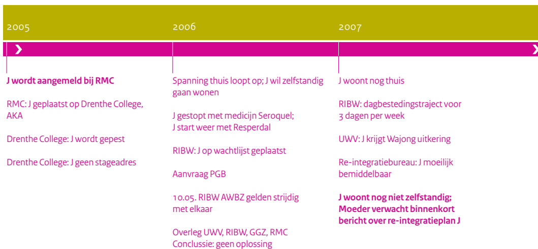
Figuur 3: Periode 2005-2007; stagnatie in opleiding en hulpaanbod