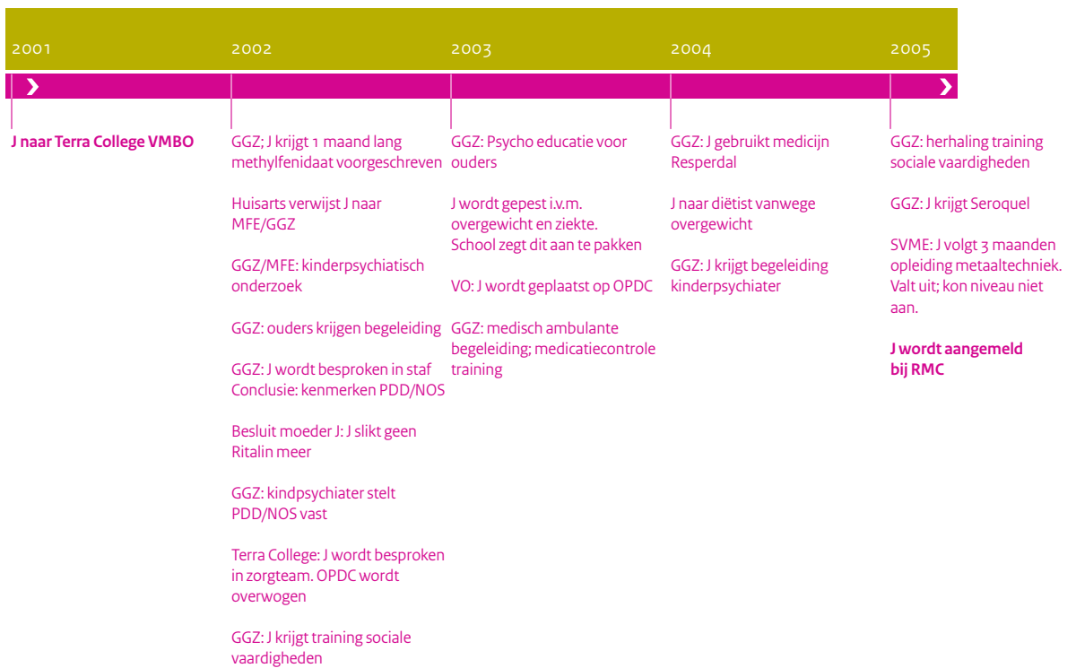
Figuur 2: Periode 2001-2005; van voortgezet onderwijs tot RMC