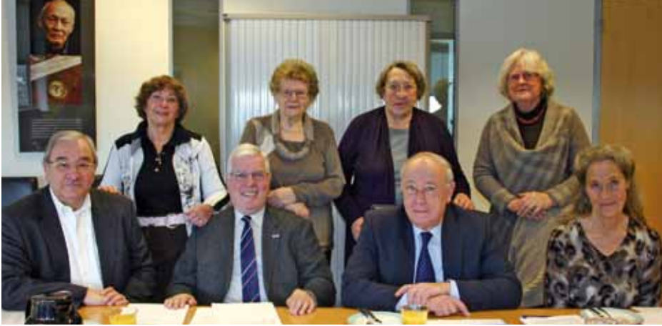
Cliëntenraad Verzetsdeelnemers en Oorlogsgetroffenen.

Een goede samenwerking is noodzakelijk voor het optimaal functioneren van de Raad. Signalen en ontwikkelingen worden daarom geregeld besproken met het management van de afdeling Verzetsdeelnemers en Oorlogsgetroffenen, de Raad van Bestuur van de SVB, het ministerie van VWS en de Cliëntenraad.