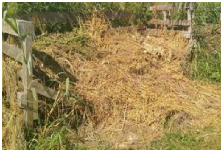
Figuur 7: A (links): Maaiselafvalhoop met beperkte aantallen resistente Aspergillus B (rechts): Maaiselafvalhoop met onkruid, met Aspergillus