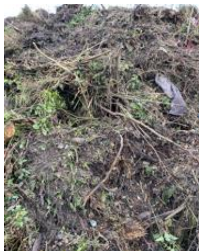
Figuur 13: Groenafval (mix) Biomassawerf B, resistente Aspergillus

Bij biomassawerf D -waar alleen tussenopslag plaatsvond en de uiteindelijke bestemming van het materiaal een andere biomassawerf was- waren de inputstromen fysiek gescheiden, zodat deze separaat bemonsterd konden worden. Het betrof bollenafval (figuur 14 hieronder, foto A), groenafval (versnipperd, 14B) en groenafval met vooral takken (14C).