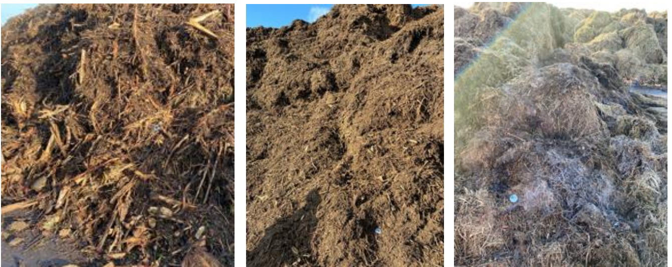
Figuur 12: A (links): Groenafvalhoop biomassawerf A, met resistente Aspergillus B (midden): Groenafval (versnipperd) biomassawerf C, met resistente Aspergillus C (rechts): Groenafval (maaisel) biomassawerf C, met resistente Aspergillus

Bij de biomassawerven zijn de aanwezige inputstromen zoveel mogelijk separaat bemonsterd. Bij biomassawerven A en C waren de inputstromen relatief homogeen (zie figuur 12 hieronder).