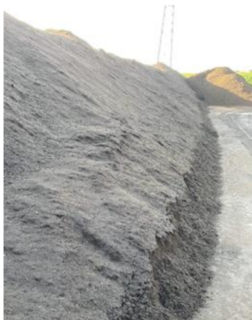
Figuur 15: Compost als eindproduct op de biomassa-werf; niet of nauwelijks resistente Aspergillus , temperatuur gedaald naar 31 °C.

In tabel 3.12 hieronder is het percentage monsters met een hoog (> 1000 CFU/g) gehalte resistente Aspergillus weergegeven. In groenafval op de biomassawerven is sprake van hoge resistentie in 63% van de monsters. Soms worden azolen aangetroffen. In het composteringsproces neemt het aantal resistente A. fumigatus sterk af.