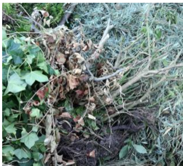
Figuur 11: Groenafvalhoop zonder resistente Aspergillus

In tabel 3.10 (op de volgende pagina) is het percentage monsters met een verhoogd (> 1000 CFU) gehalte resistente A. fumigatus weergegeven. In groenafval op de gemeentewerven is dit het geval in 33% van de monsters.