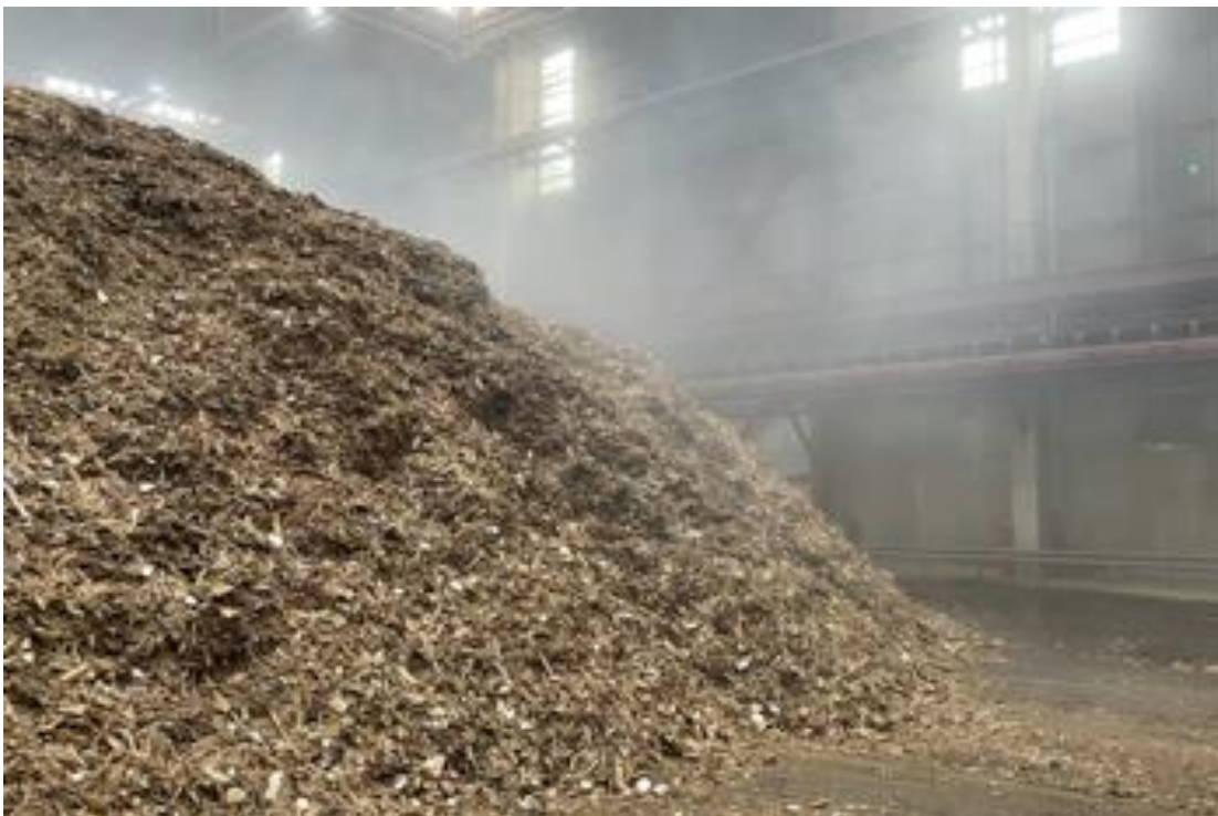
Figuur 5: Foto van categorie B-houtafvalhoop, met resistente Aspergillus , binnen, bij een energiecentrale

In één monster bij een energiecentrale is een hoog gehalte A. fumigatus aangetroffen met een resistentiepercentage van 19% (zie tabel 3.2 op de volgende pagina). Dit monster bestaat uit fijngemalen bouw- en slooafval, snoeihout en 1% GFT-afval (zie figuur 5 hieronder) en bevat naast propiconazool en tebuconazool ook azaconazool, prochloraz en imazalil. De eerste twee azolen worden zowel bij de houtbehandeling als bij de teelt van groente en fruit gebruikt. De andere drie worden alleen in (deels buitenlands geteelde) groene en fruit toegepast en zijn waarschijnlijk via de 1% GFT in de afvalhoop terecht gekomen.