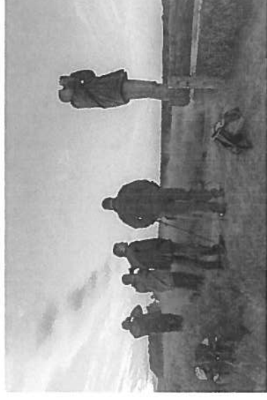
Komt dat zien: wilde dieren bij Natuurmonumenten

Een maatregel die de zichtbaarheid ook vergroot is het beëindigen van afschot, omdat de schuwheid van de dieren dan afneemt. Maar dan zal het moeilijker worden om een balans te vinden met andere belangen zoals landbouw en verkeersveiligheid. Met dit pakket vergroten we de zichtbaarheid van wilde dieren zonder dat daarvoor de aantallen per hectare vergroot moeten worden. Overigens blijft het nodig om delen van gebieden af te sluiten voor wandelaars en fietsers, zodat dieren in alle rust hun jongen kunnen groot brengen. De enquête maakt duidelijk dat de achterban daarvoor veel begrip heeft.