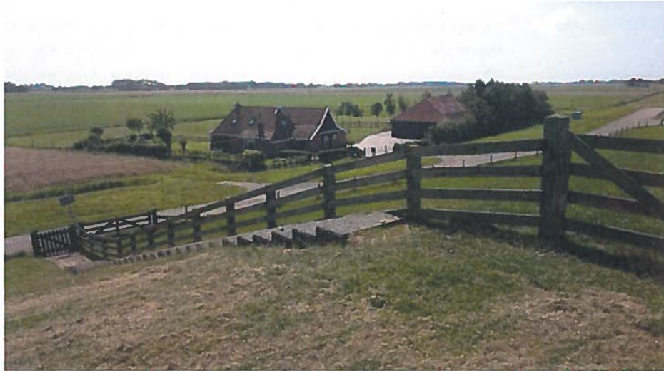
Het Friese waddegebied bij Ferwerd. Er vinden hier nauwelijks ontwikkelingen plaats.

Enkele gemeenten zijn actief bezig met het behoud van de landschappelijke kwaliteiten van Waddenzee, bijvoorbeeld voor wat betreft de duisternis. Zo is in Franekeradeel in een strook langs de Waddenzee de straatverlichting achterwege gelaten en worden kassen aan de zijkant afgeschermd. Verdere uitbreiding van de glastuinbouw is voorzien, waarbij afspraken zijn gemaakt over beperking van de lichtuitstraling. Texel wil reguliere verlichting vervangen door dimbare led-lampen.