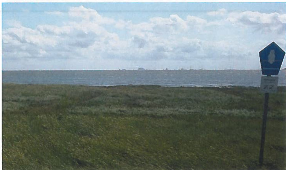
De Eemshaven, inclusief olie-opslagtanks en windturbines, is goed te zien vanaf de Waddenzee en ook vanaf het eiland Borkum, 15-20 km er vandaan.