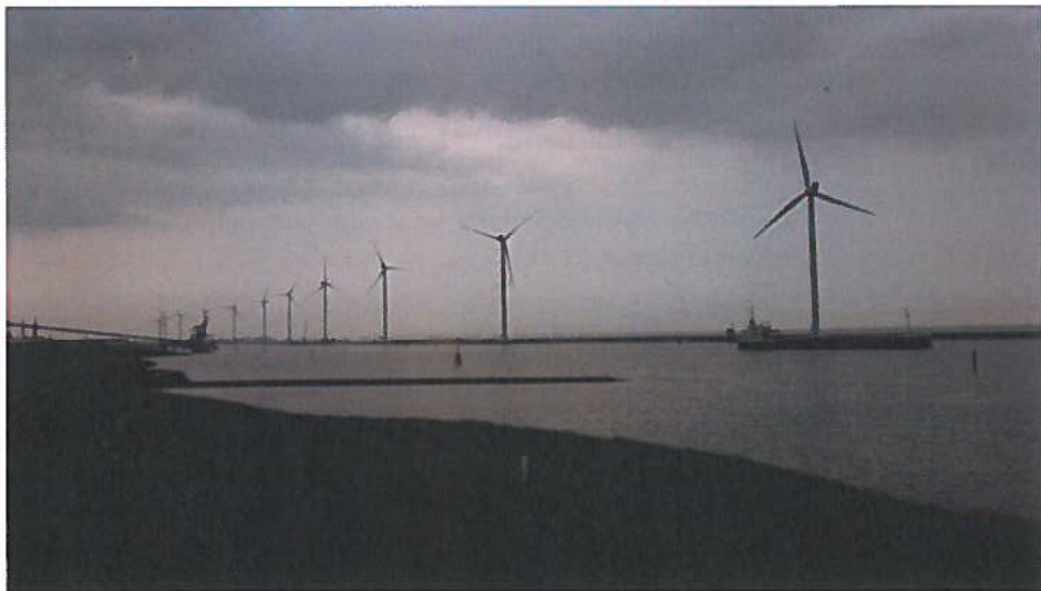
Windturbines langs de Eems-Dollard ten zuiden van Delfzijl.

Het is opvallend dat in het Eems-Dollardgebied een aantal windturbineparken aanwezig is, die tot ver op de Waddenzee zichtbaar zijn. Artikel 2.5.12 zegt hierover dat in bestemmingsplannen in buitenstedelijk gebied regels dienen te worden opgenomen die ertoe strekken dat de maximaal toelaatbare bouwhoogten alsmede de aard of de functie van nieuwe bebouwing passen bij de aard van het omringende landschap. Indien het gaat om bestemmingsplannen die de havengerelateerde en stedelijke bebouwing in Den Helder, Harlingen de Eemshaven en Delfzijl mogelijk maken, kan hiervan worden afgeweken.